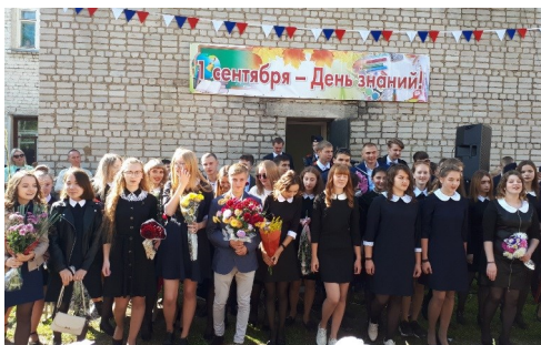
1 сентября 🍂 День знаний