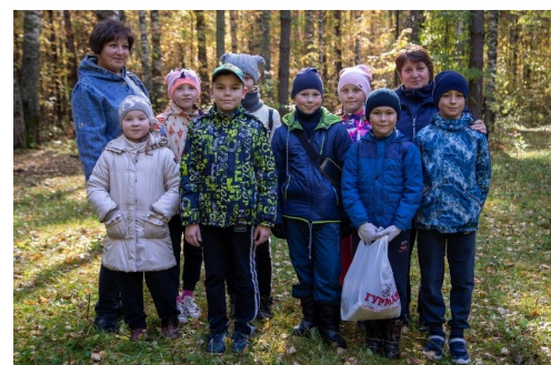
Квест «Чистые игры»