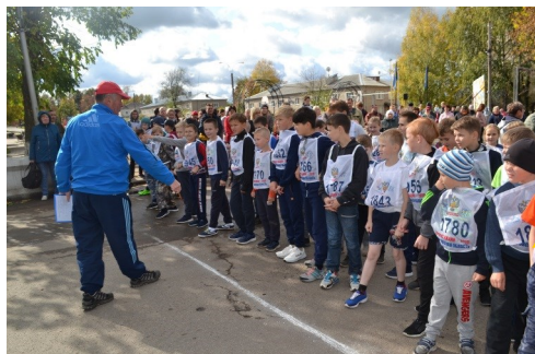
Всероссийский день бега «Кросс нации-2019»