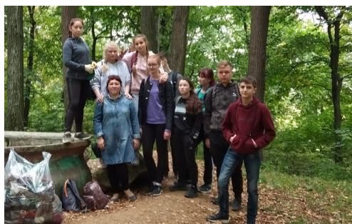
Акция «Зеленая Россия»