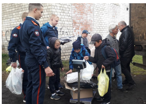
Акция «Бумажный бум»